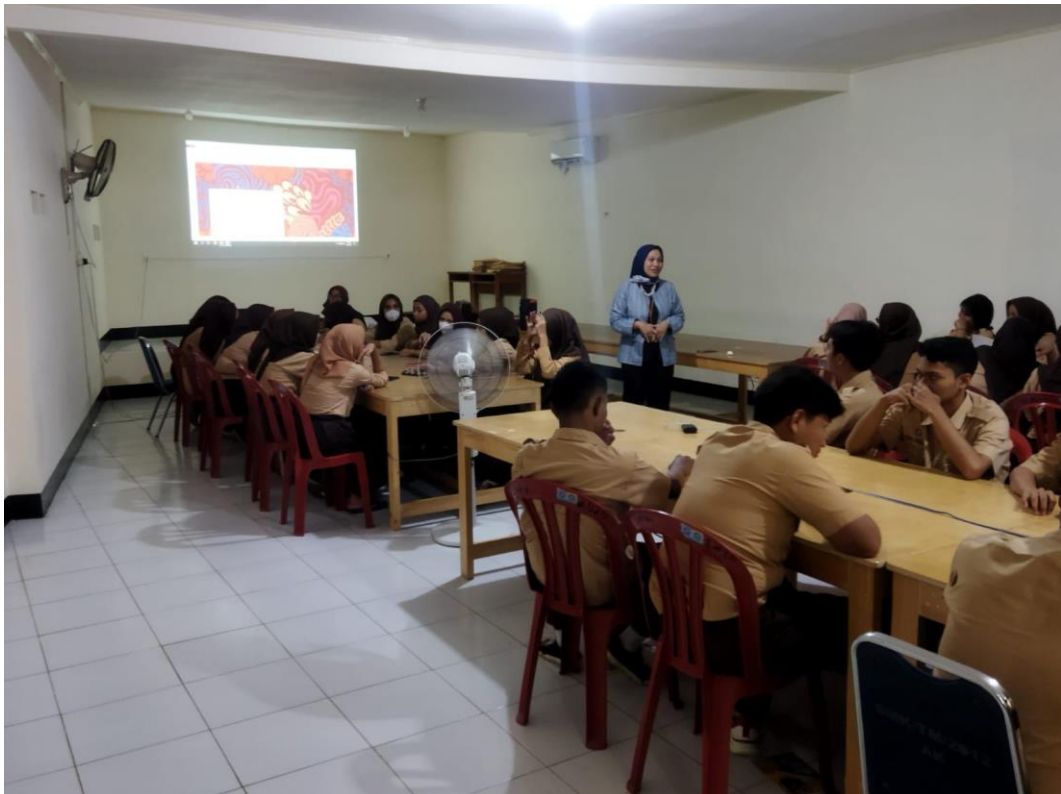
Gambar 2. Pemberian Materi Mencari Ide Bisnis