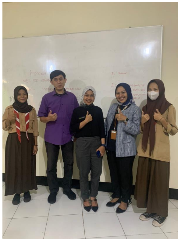
Gambar 4. Sesi Foto bersama Perwakilan Mitra dan Peserta

berjalan. Dukungan pelatihan, motivasi, dan pemahaman guna meningkatkan kualitas keterampilan mitra PKM diharapkan mendukung keterampilan dan keahlian mitra yang merupakan siswa-siswi SMK. Harapan ini semoga dapat memberikan sumbangsih nyata bagi masyarakat ke depannya. Adanya usulan dari peserta untuk perlu diselenggarakan kegiatan lanjutan ataupun perlu diselenggarakan kegiatan baru dengan topik yang berbeda menunjukkan minat mitra untuk tetap melakukan kegiatan di SMK Tunas markatin.