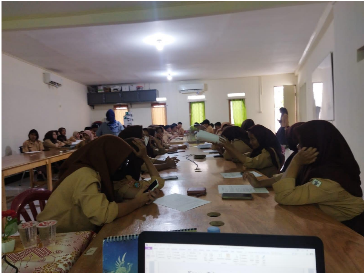
Gambar 3. Berlatih Membuat Perencanaan Bisnis